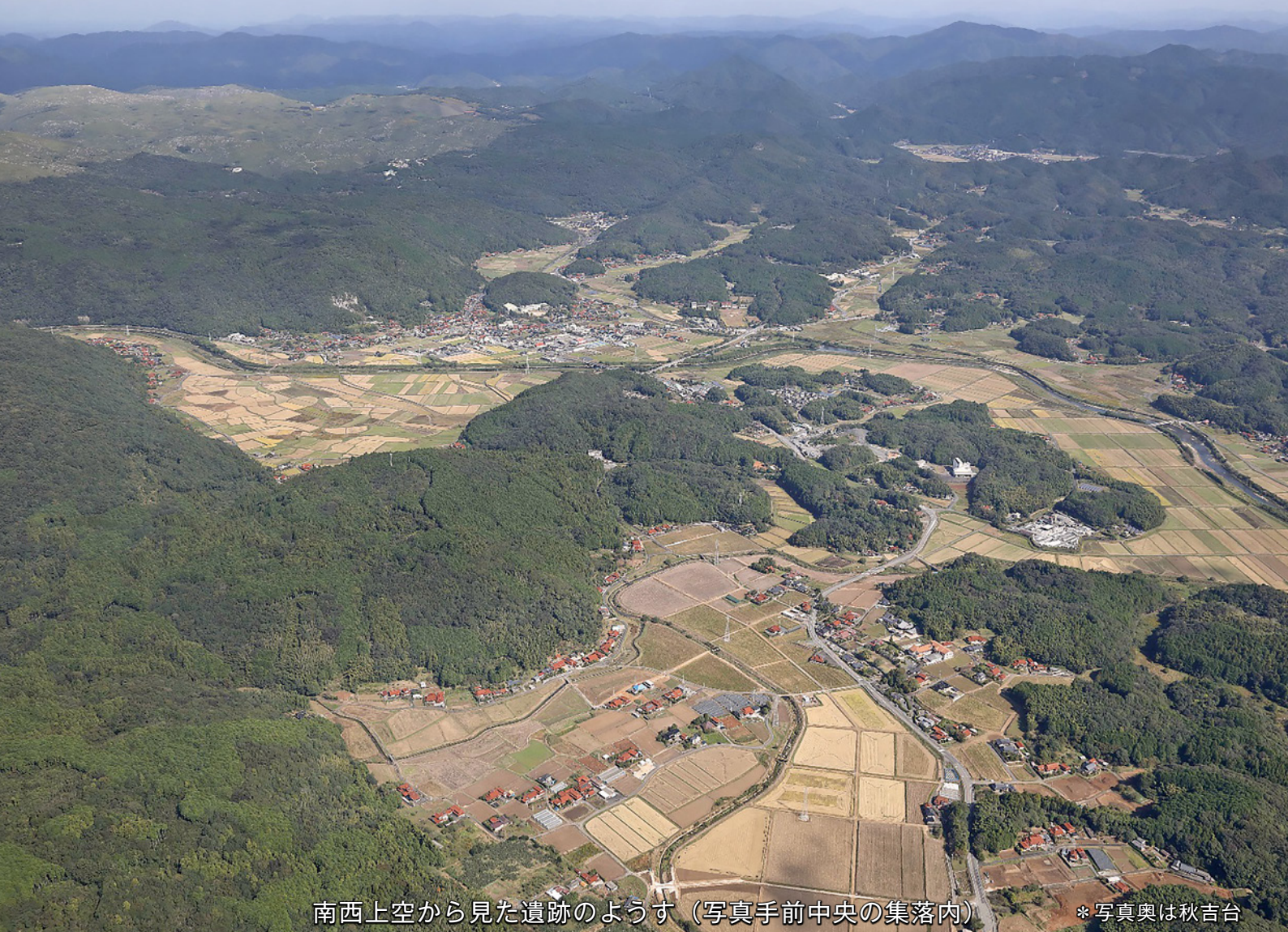
南西上空から見た遺跡のようす (写真手前中央の集落内)