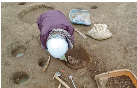
柱穴の中の土器を掘る

編集・発行 公益財団法人山口県ひとづくり財団 山口県埋蔵文化財センター 〒753-0073 山口市春日町3番22号 TEL:083-923-1060 FAX:083-923-2001 URL: http://www.y-maibun.jp/