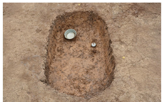
青磁・白磁が副葬された中世の墓