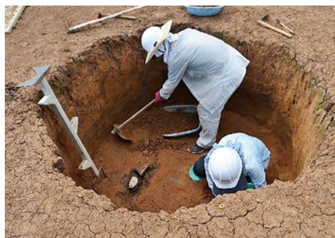
円形土坑の調査のようす