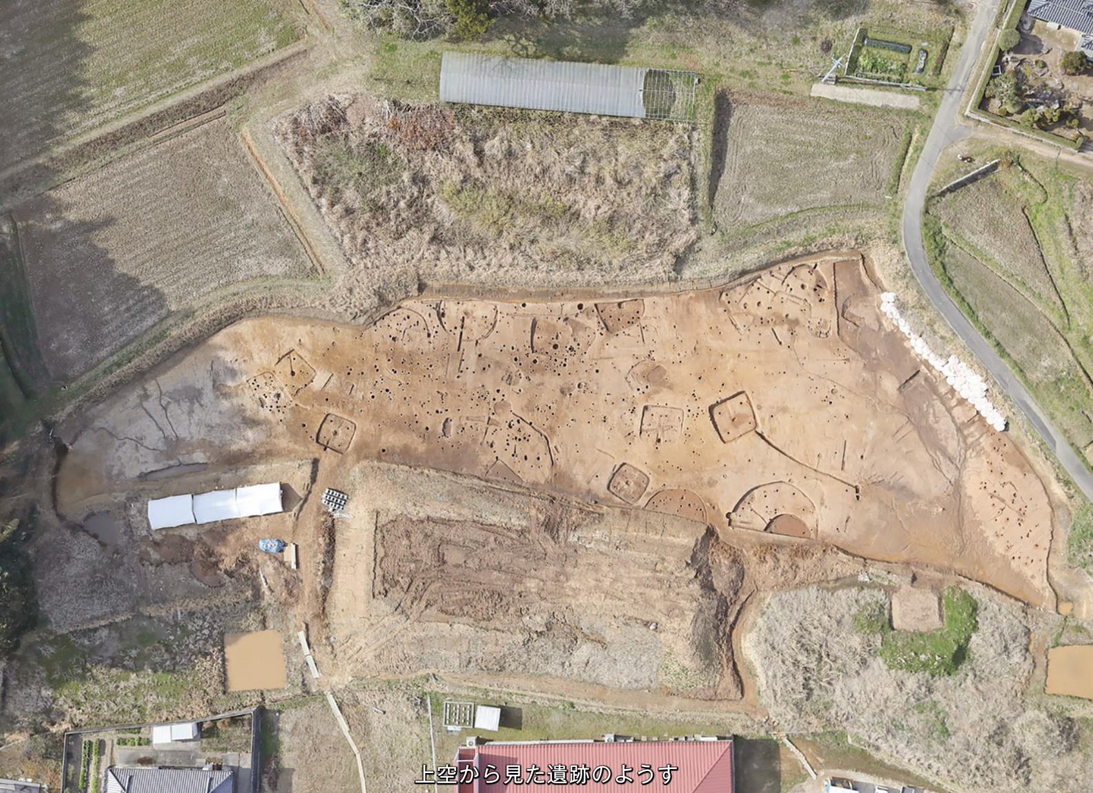
上空から見た遺跡のようす