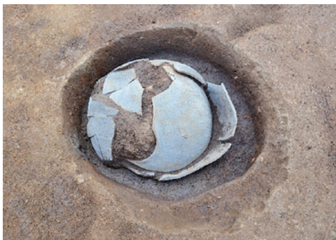
埋められていた須恵器の甕