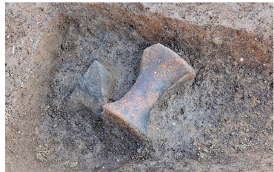
溝から出土した土器をのせる台