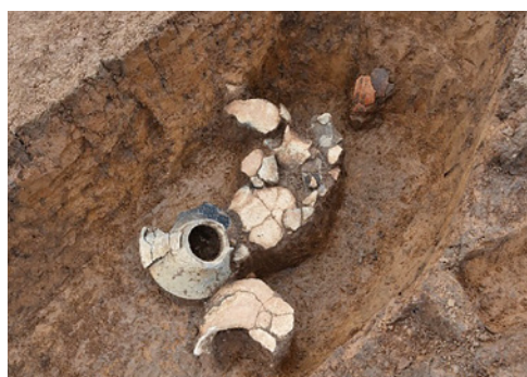
土坑から出土した弥生土器

このほか、中世の墓や掘立柱 ほったてばしら 建物も発見されました。墓は有力者のものとみられ、副葬品として中国製の青磁 せいじ の椀と白磁 はくじ の皿が重ねられた、非常に珍しい状態で発見されました。