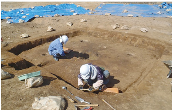
竪穴建物内での発掘作業