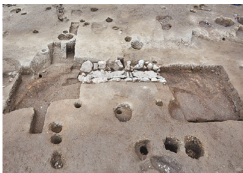
両側に溝をもつ炉跡 (SL23)