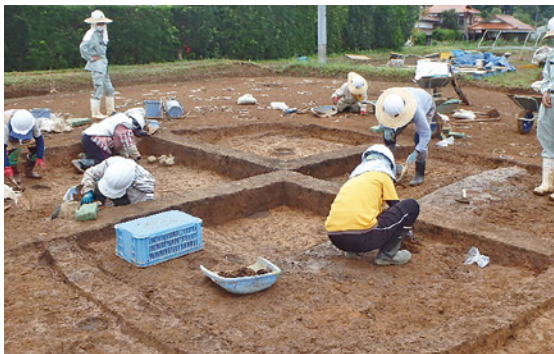
2区竪穴建物の調査のようす