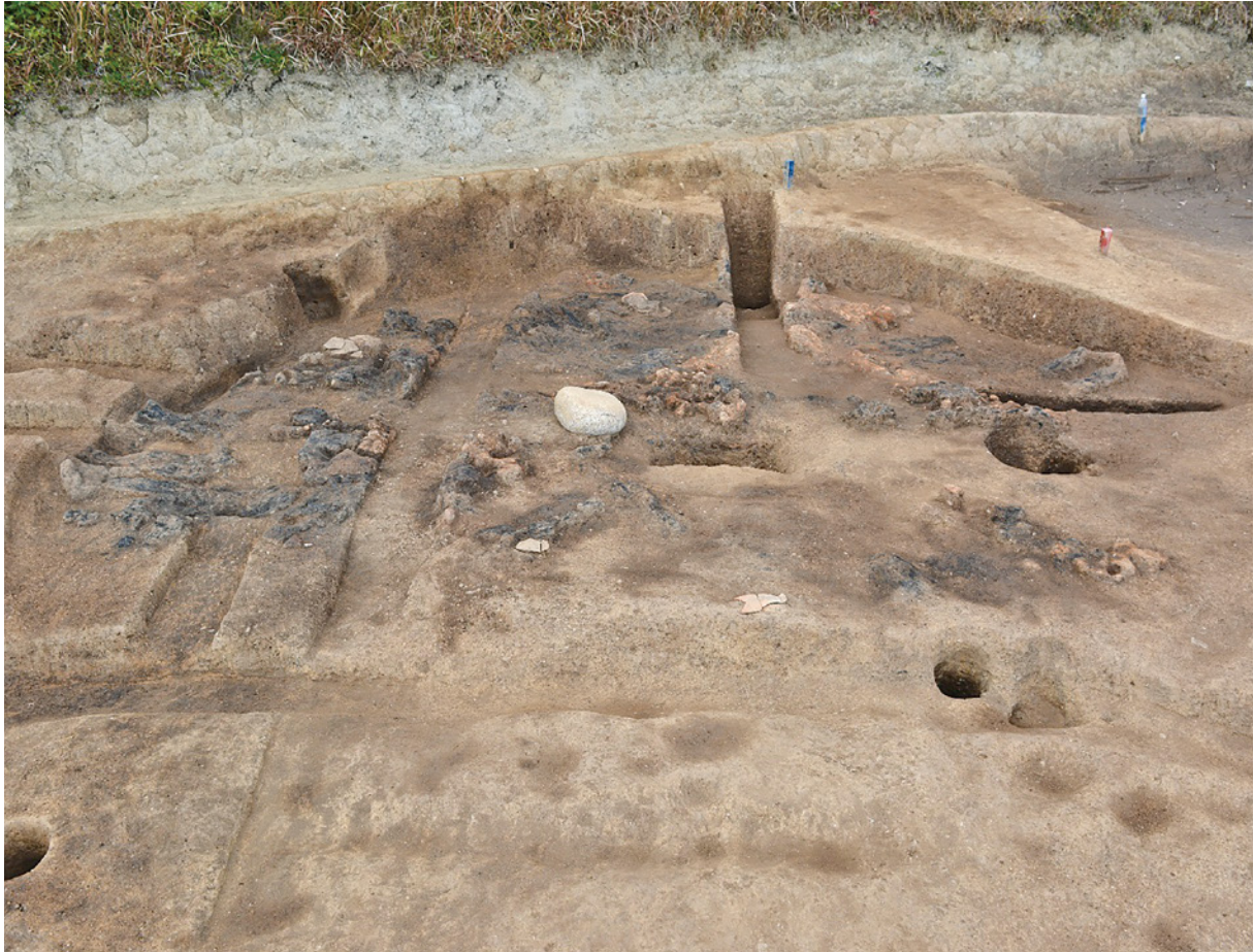
竪穴建物に残る焼土と炭化材