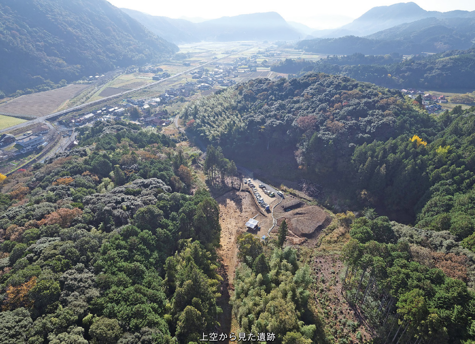
上空から見た遺跡