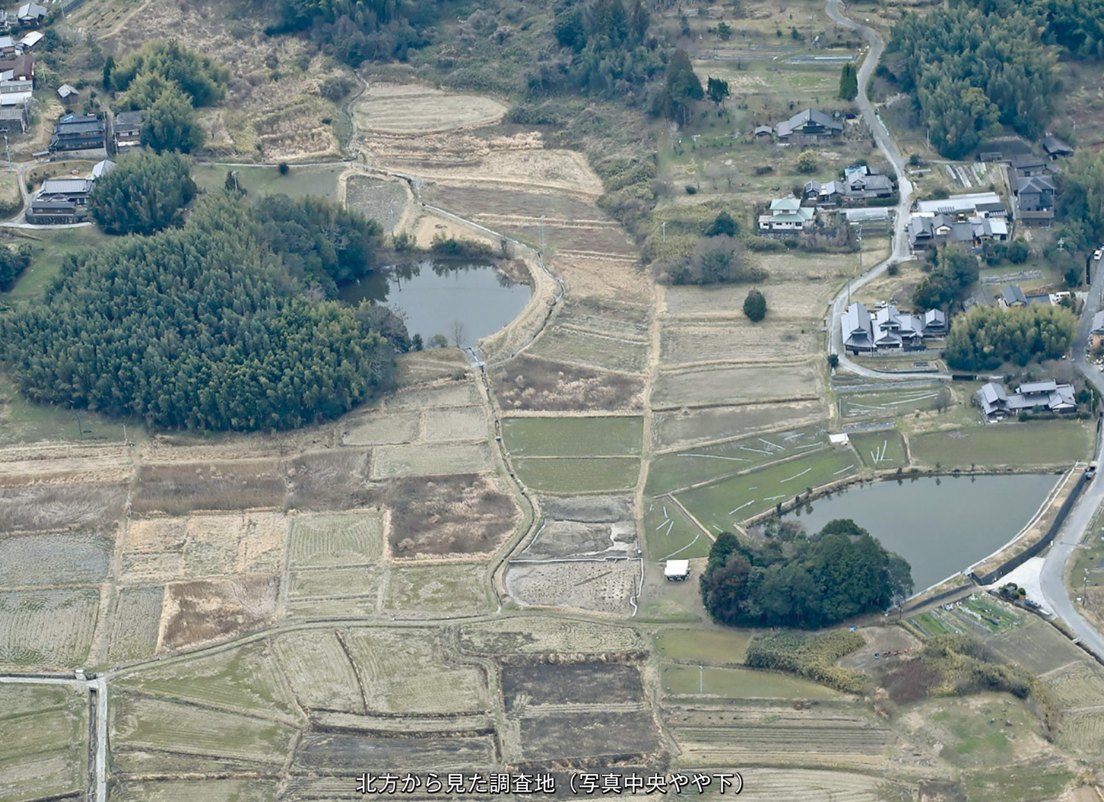
北方から見た調査地（写真中央やや下）