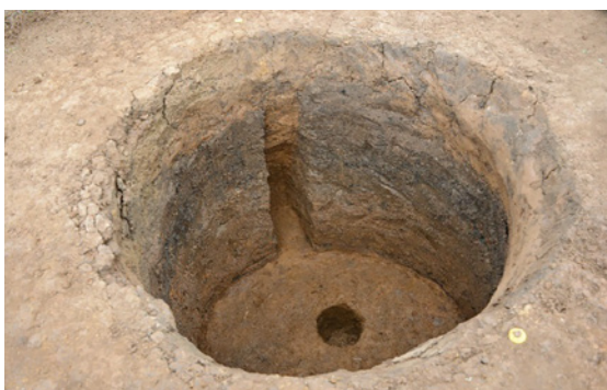
検出された袋状土坑