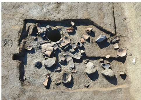
多くの弥生土器が捨てられた穴