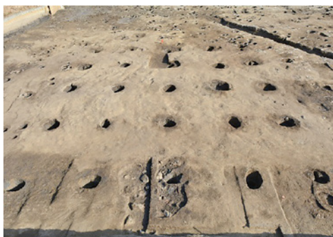
鎌倉時代の大型掘立柱建物