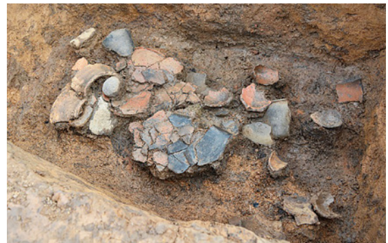
土器が大量に投棄された土坑