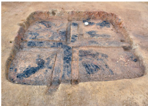
竪穴建物に残る炭化した屋根材